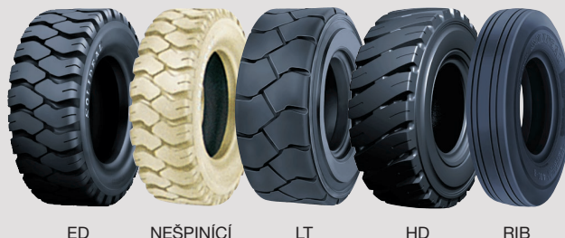
ED NEŠPINÍCÍ LT HD RIB